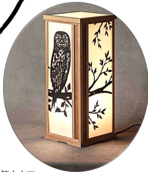
早川鉄兵×笹木木工 「切り絵行灯／フクロウ」 W20×D20×H48 cm