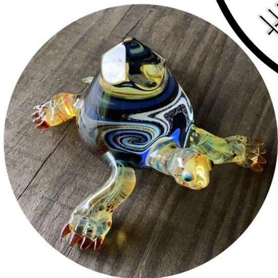
ガラスアート 林 和浩 「TURTLE 大」 W13.5×D13.5×H7.5 cm