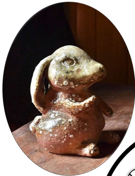
信楽焼 山田晃一郎 信楽窯変姿「窯変兎」 W14×D16×H18 cm