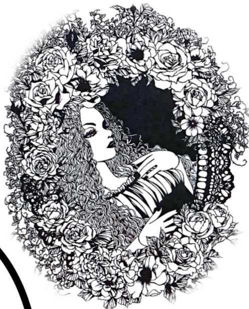
切り絵 Aika 「DOLL」額 W37×D2.5×H45 cm