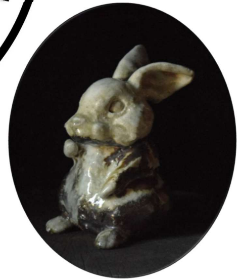
信楽焼 山田晃一郎 はふり志野姿「縞兔」 W14×D16×H18 cm