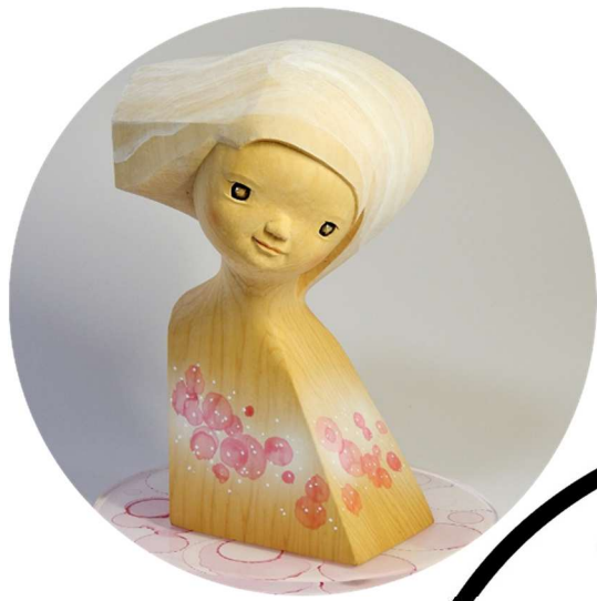
木彫 伊原栄一 DANCE (ピンク)・カヤ W11×D10×H22 cm