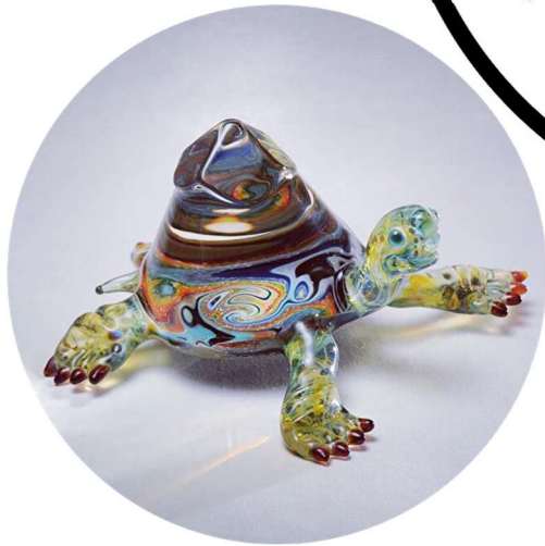
ガラスアート 林 和浩 「TURTLE 大」 W13.5×D13.5×H7.5 cm